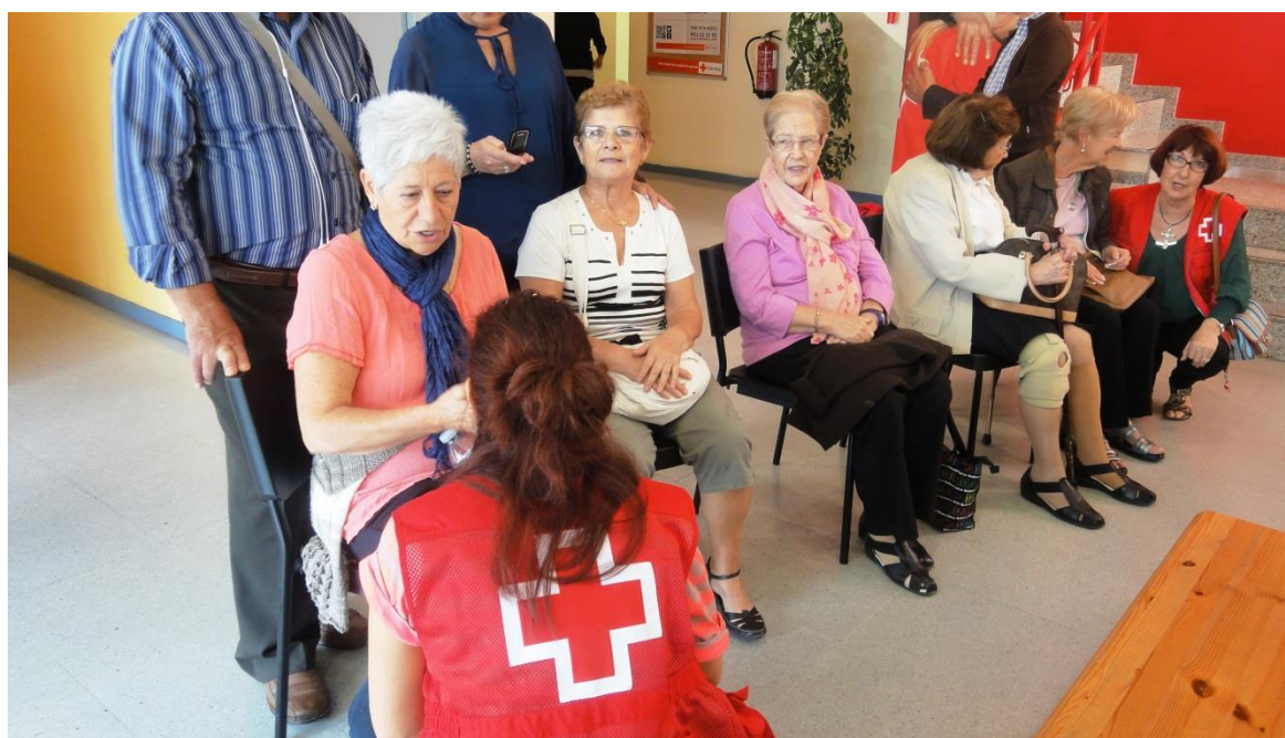
Foto: Sortida al Palau de la Música

Humanitat Imparcialitat Neutralitat Independència Voluntariat Unitat Universalitat