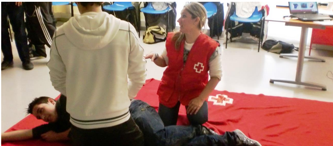
Foto: Formadora i alumnes del taller a les instal·lacions de Creu Roja.

Un total de 56 alumnes han realitzat els dos tallers programats.