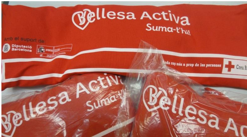
Foto: Coixins terapèutics