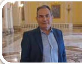
Sebastián Moralo Gallego Magistrat del Tribunal Suprem