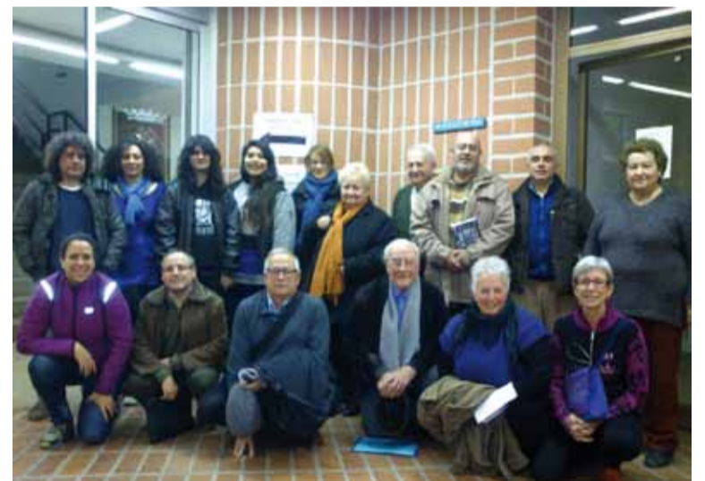
Membres del Grup Motor

A dia d'avui s'han fet dues reunions per començar a treballar. La primera va ser una presentació del model de participació que hem dissenyat i